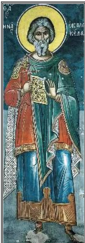
Св. мъченик Мина. Фреска. Атон (м-р Дионисиат). 1547 г.

Страдание на светите мъченици Мина, Ермоген и Евграф (ок. 313 г.)