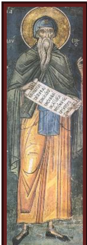
Свети преподобни Паусий Велики. Фреска от Атон, манастир Дионисиат. 1547 г.

„Суетната прелест на този свят, тленна и преходна, привлича към себе си хората, жадуващи за нея, и ги кара заради нищожна земна радост да грешат в своите намерения и чувства, и в ума си да се прилепяват към низките страсти, и при това до такава степен, че тези обичащи света хора понякога започват не само да презират обещания им небесен живот, но, уви, да се отвръщат от Самия Творец на истинния живот и повече да се стремят към временните и земни блага, отколкото към бъдещите, доброволно подготвяйки си с това мъчителна и вечна смърт; подобно на това, и вечното съкровище на небесата поражда безкраен стремеж към