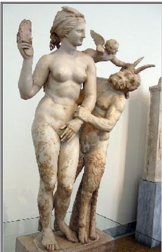
Гръцка скулптурна група - Афродита, Ерос и „бог“ Пан. 100 години пр. Р.Х. (3 демона в различни форми)

Ето например древни статуи на Афродита ( позната още и с мъжко име Афродитус, а в римския пантеон като Венера ), показващи ОТКРИТО РАЗВРАТА И ДЕМОНИЧНАТА И' СЪЩНОСТ: