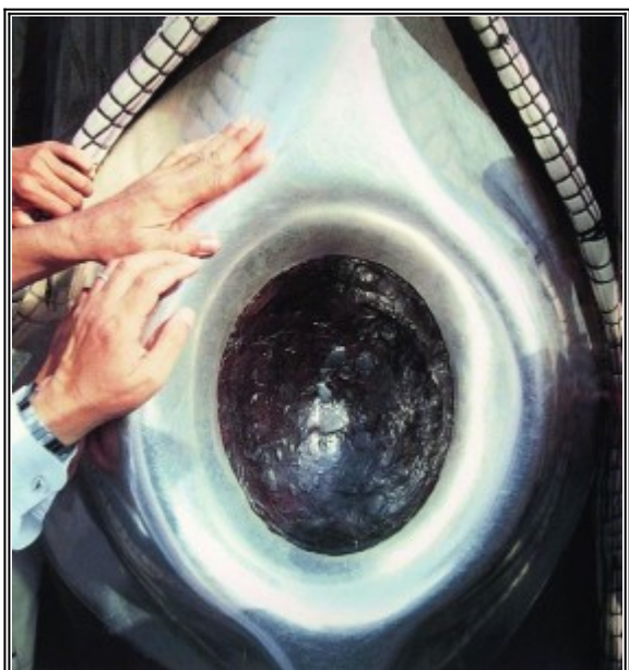
"СВЕЩЕНИЯ" ЧЕРЕН КАМЪК, ВГРАДЕН В ХРАМА КААБА

СЕГА ТОЗИ ЧЕРЕН КАМЪК ОТ МЕТЕОРИТ СЕ НАМИРА В МЕКА, В КААБА. ВГРАДЕН Е В НЕЩО КАТО СРЕБЪРЕН ЖЕНСКИ ПОЛОВ ОРГАН И Е ЦЕНТРАЛЕН КУЛТОВ ЕЛЕМЕНТ НА ПОКЛОНЕНИЕ В ИСЛЯМА: