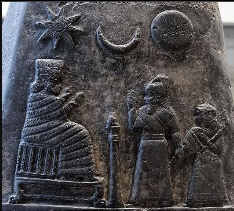
Плочка с друг образ на Инана, на който се вижда нейния символ - осем лъчевата звезда, символизираща Венера и полумесеца на нейния баща Син