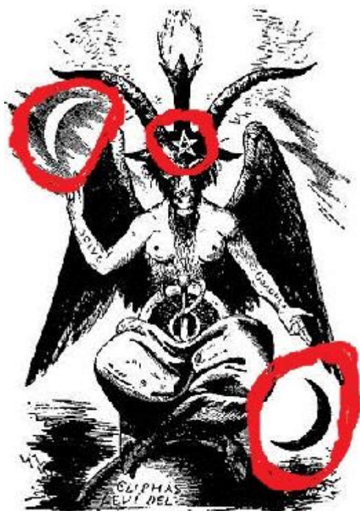
THE SABBAIC GOAT

От Венера (Деница) е паднал гордия ангел, както знаем от Библията: „Как падна ти от небето, деннице, сине на зората! Разби се о земята ти, който тъпчеше народите. А в сърце си думаше: ще възляза на небето, ще издигна престола си по-горе от Божиите звезди и ще седна на планината в събора на боговете, накрай север; ще възляза в облачните висини, ще бъда подобен на Всевишния. Но ти си свален в ада, вдън преизподнята.“ (Исая 14: 12-15).