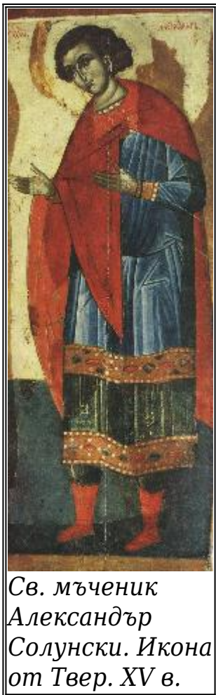
Св. мъченик Александър Солунски. Икона от Твер. XV в.

С вети Александър претърпял жестоки мъчения по време на царуването на Максимиан. Като изповядал себе си за християнин, той бил заловен и принуждаван да принесе жертви на идолите. Той не само че не се подчинил, но като се изпълнил с още по-голяма ревност към Бога, съборил жертвеника, върху който имало принесени жертви. Разгневен, Максимиан заповядал да му отсекаат главата. Палачът замахнал с меча, но изведнъж се спрял.