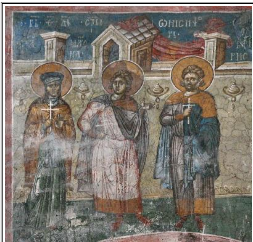
Св. преподобна Матрона, свв. мъченици Онисифор и Порфирий. Фреска от църквата "Христос Пантократор". Дечани. Косово. Сърбия. Около 1350 г.

Житие и подвизи на преподобната наша майка Матрона (ок. 492 г.)