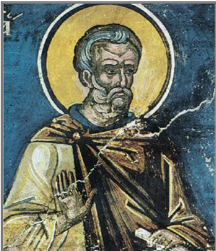
Св. преподобни Иоан Колов. Фреска от Атон (Дионисиат). 1547 г.

Н а девети ноември Православната Църква облажава и празнува паметта на преподобния Иоан Колов. Това свое название преподобният получил заради малкия си ръст. Още в младите си години той оставил света и заедно с брат си Даниил отишъл в Скитската Египетска пустиня. Отначало той и брат му Даниил се подвизавали усърдно в пълно уединение, но после той осъзнал, че при неговия пламенен и страстен характер може да живее строго пустиннически само под строгото ръководство на други, по-опитни подвижници - старци. До тази мисъл, го довело следното събитие, което станало скоро след поселването на двамата братя в пустинята. Веднъж преподобният съвсем неочаквано казал на своя брат и сподвижник: