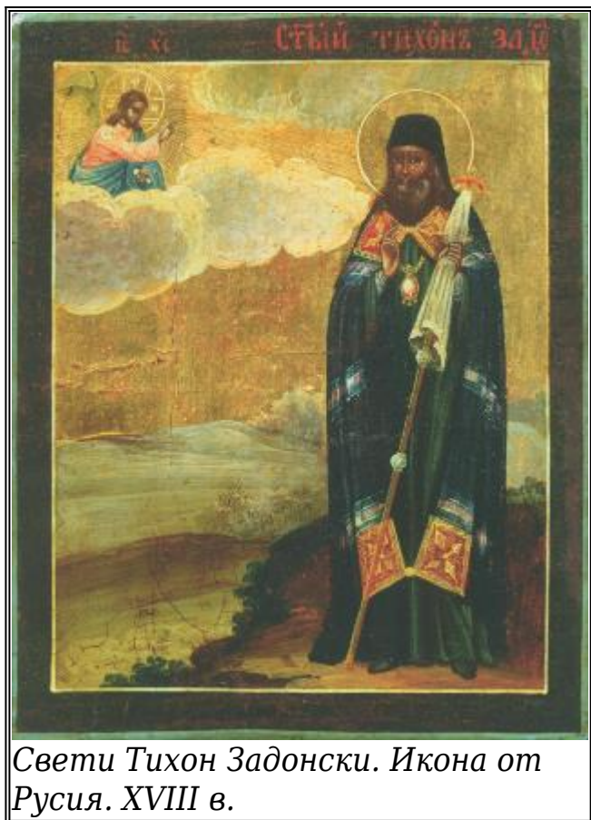
Свети Тихон Задонски. Икона от Русия. XVIII в.

П ри описании жития отечественных святых, утешительно и ободрительно для сердец наших явление земле Русской угодников Божиих, ясно доказывающее, что не оскудела и для нас благодать Божия, всегда восполняющая то, что оскудевает в слабой природе человеческой. И какое торжество для Церкви православной, прославляемой верными сынами своими! Господь увенчал их венцами нетления во свидетельство их подвигов и правого исповедания той Церкви, которая и доселе есть столп и утверждение истины.