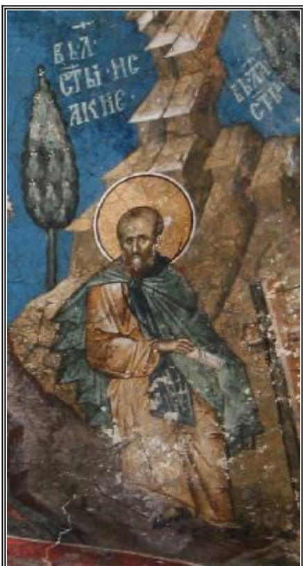
Св. преподобни Исаакий Далматски. Фреска от църквата "Христос Пантократор". Дечани, Косово, Сърбия. Около 1350 г.

Житие на св. преподобни Исаакий (383 г.), Далмат (след 446 г.) и Фавст (V в.)