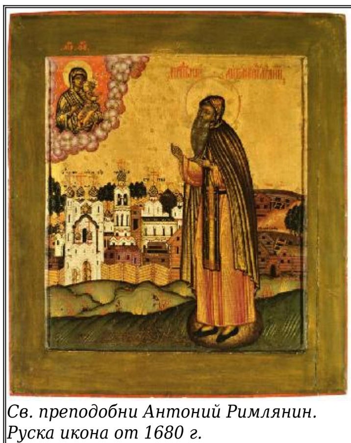
Св. преподобни Антоний Римлянин. Руска икона от 1680 г.

П реподобный Антоний Римлянин родился в Риме в 1067 году от богатых родителей, державшихся православного исповедания веры, и был воспитан ими в благочестии. Лишившись родителей в 17 лет, он принялся за изучение писаний отцов на греческом языке. Затем он раздал часть наследства нищим, а другую вложил в деревянную бочку и пустил ее в море. Сам же принял пострижение в одном из пустынных скитов, где прожил 20 лет. Гонение со стороны латинян на православных принудило братию разойтись. Преподобный Антоний скитался, переходя с места на место,