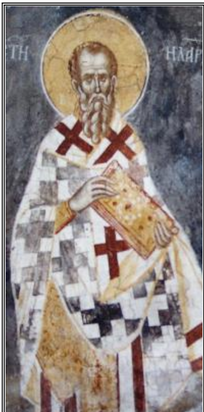
Св. Иларион Мъгленски. Фреска от църквата "Христос Пантократор". Дечани. Косово. Сърбия. Около 1350 г.

Б лаженият Иларион произлезе от родители много бележити и боголюбиви, усърдни във всичките Господни заповеди и постоянната молитва. Те бяха бездетни и желанието им беше да получат плод от своя брак. Майка му възложи себе си на Божията Майка и често прибягваше към нейния храм и проливаше пред нея своите сърдечни стенания и горещи сълзи. Една нощ се яви Пресвета Богородица в сънно видение и като я побутна с ногата си, рече: "Стани, жено, защото ще получиш исканото! Ще родиш син, който ще обърне мнозина от дълбока заблуда към светлината на богопознанието." След време тя зачена и роди блажения Иларион. Когато беше на три години, детето запя ангелската песен: "Свят, свят, свят е Единият Бог." Майката като чу това,