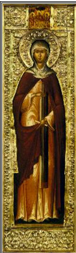
Св. преподобномъченица Евдокия. Икона от Русия. XVII в.

Житие и страдание на преподобномъченица Евдокия (ок. 160-170 г.)