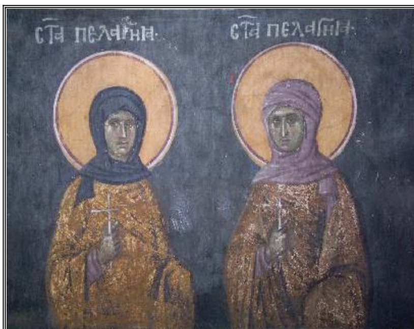
Свв. преподобна Пелагия и мъченица Пелагия. Фреска от църквата "Благовещение" в Грачаница, Косово, Сърбия. Около 1318 г.

- Заклевам те в името на Светата и Неразделна Троица - не внасяй нищо от това злато нито в епископския дом, нито в църквата Божия, нито в своя дом, нито в дома на когото и да било от клириците. Но раздай всичко със собствените си ръце на бедните, нищите и немощните, та това, което е събрано чрез зли дела, да бъде изразходвано за добро, и греховното богатство да стане богатство на правдата. А ако нарушиш тази клетва, да бъде анатема над твоя дом и да наследиш еднаква участ с тия, които викали: "разпни Го, разпни!"