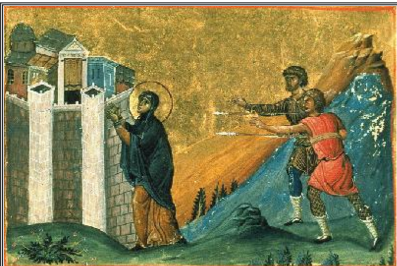
Св. мъченица Пелагия Антиохийская. Миниатюра от минологията на Василий II. Константинопол. 985 г.

С вета Пелагия живяла в Антиохия Сирийска по време на царуването на Диоклетиан. Тя произхождала от знатен род. Управителят на града разбрал, че тя е християнка, и изпратил войници, за да я заловят. Войниците, изпълнявайки заповедта на управителя, обкръжили дома, в който тя живеела. Тогава света Пелагия ги помолила да почакат малко и след като те се съгласили да изпълнят молбата, светата застанала с лице на изток на мястото, където обикновено се молела, и като издигнала ръцете си и очите си към небето, започнала усърдно да моли Бога да не я предава в ръцете на войниците, но да я приеме при Себе Си като непорочна и чиста жертва. След това тя се облякла в най-хубавите си дрехи, хвърлила се от покрива на дома си и предала духа си на Бога.