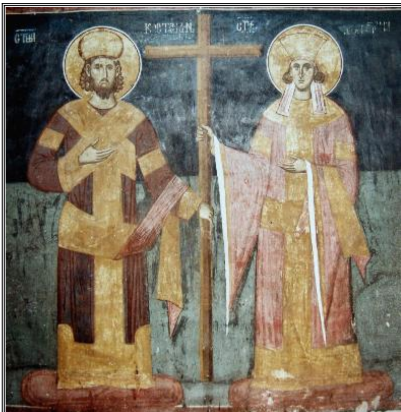
Св. Равноапостолни Константин и Елена. Фреска. Църква Христос Пантократор. Дечани. Сърбия (Косово). Около 1350 г.

Житие на светите равноапостолни цар Константин (337 г.) и неговата майка царица Елена (327 г.)