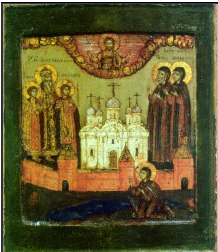
Муромските светители. Икона. Русия. Края на XVII в.

Впоследствии времени родственник святого князя Константина, благоверный князь Георгий Ярославич, возобновил первоначальную церковь Благовещения Пресвятой Богородицы 3391 , и с того времени прославил Господь святых князей, Константина и сыновей его, так как у гробов их стали совершаться чудеса.