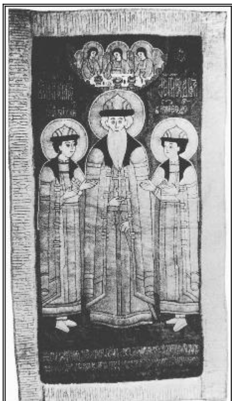
"Святите Константин, Михаил и Теодор Муромски". Шит покров. Русия. 1661 г.

С ей святой благоверной великий князь Константин Святославич происходил из рода великого князя Владимира, крестившего святым крещением землю Русскую. В 1192 году вместе с сыновьями своими князьями Михаилом и Феодором из славного города Шева он пришел в рязанскую землю к городу Мурому. В этом городе жили в то время язычники, не просвещенные еще познанием истинного