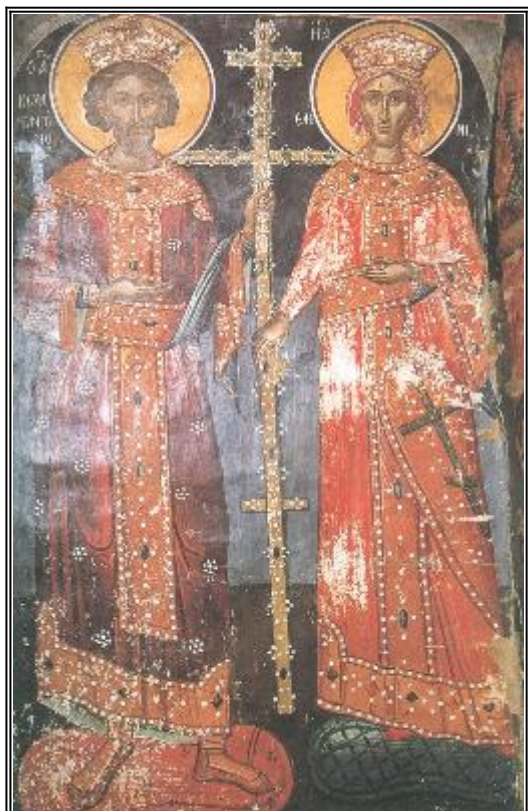
Свв. Равноапостолни Константин и Елена. Фреска. Манастир Метеора. 1527 г.

като дар за своя син Константин. Недълго след това блажената царица майка починала и била честно погребана.