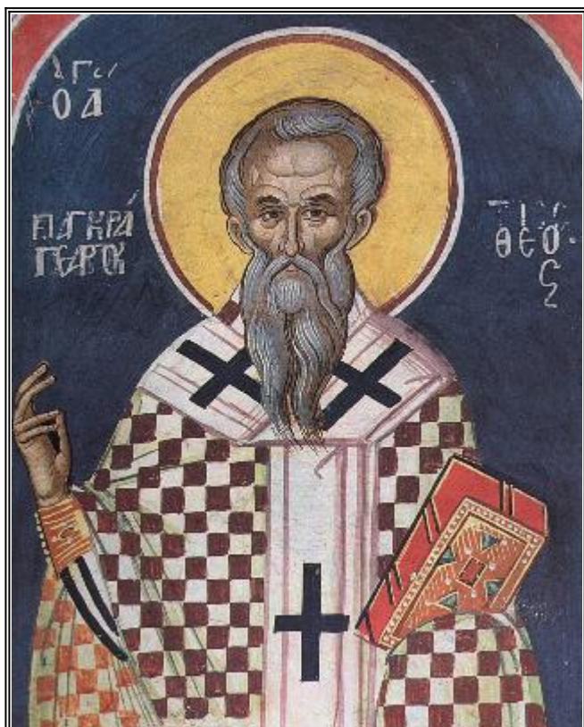
Св. священомъченик Панкратий, епископ Тавроменийски. Фреска от Атон - манастир Дионисиат. 1547 г.

В памет на свети священомъченик Панкратий, епископ Тавроменийски (I в.)