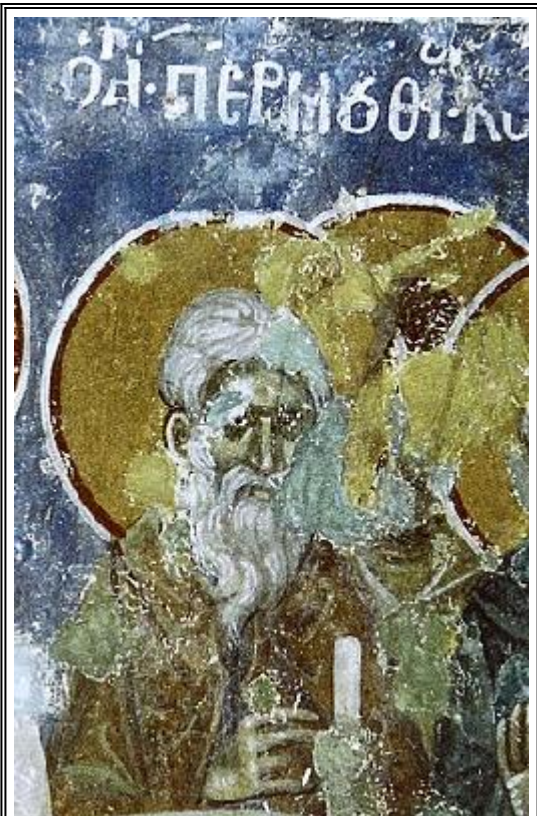
Св. преподобни Патермутий