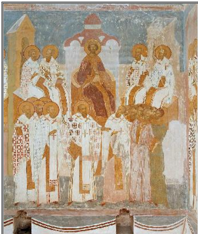
Втори Вселенски събор. Фреска от Ферапонтов манастир, събор Рождество Богородично

К ато Глава и Основател на войнстващата Църква на земята, Господ Иисус Христос, и оставил велико обещание, вселяващо мъжество в сърцата на верните негови последователи: "Ще съградя Църквата Си" - изрекъл Той - и портите адови няма да и надделеят". Но това радостно