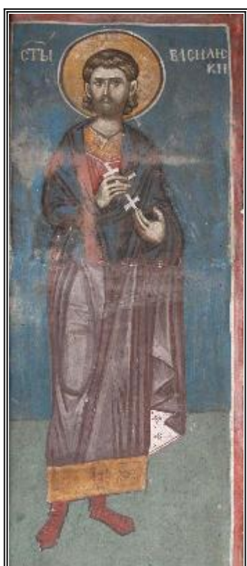
Мъченик Василиск. Фреска. Църква Христос Пантократор. Дечани. Косово. Сърбия. Около 1350 г.

Страдание на свети мъченик Василиск (308 г.)