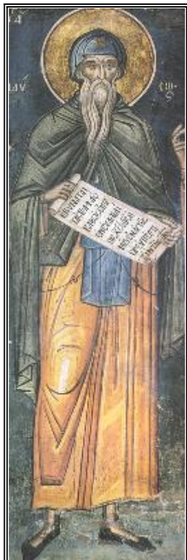
Свети преподобни Паусий Велики. Фреска от Атон, манастир Дионисиат. 1547 г.

С уетната прелест на този свят, тленна и преходна, привлича към себе си хората, жадуващи за нея, и ги кара заради нищожна земна радост да грешат в своите намерения и чувства, и в ума си да се прилепяват към низките страсти, и при това до такава степен, че тези обичащи света хора понякога започват не само да презират обещания им небесен живот, но, уви, да се отвръщат от Самия Творец на истинния живот и повече да се стремят към временните и земни блага, отколкото към бъдещите, доброволно подготвяйки си с това мъчителна и вечна смърт; подобно на това, и вечното съкровище на небесата поражда безкраен стремеж към себе си у хората, уповаващи се да го достигнат, и насища сърцата