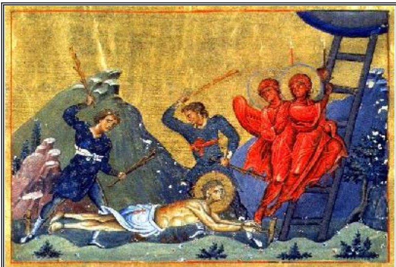
Мъченичество на свети Ананий Персиянин. Миниатюра от минологията на Василий II. Константинопол. 985 г..

У роженец Арбелы (ныне Эрбиль, Ирак) в Персии, мирянин, он прославился добродетелями и крепостью веры. Претерпев мучения, святой Анания не отрёкся от веры и был казнён.