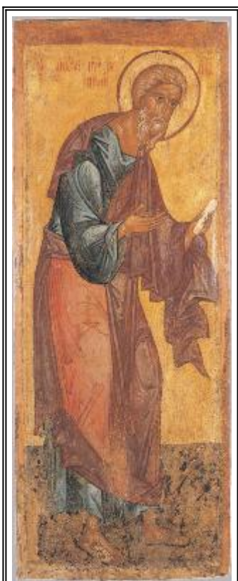
Апостол Андрей Първозвани. Икона от Ростов. XV в.

С вети Андрей, Първозваният Христов апостол, син на един евреин, на име Иона, брат на светия първовърховен апостол Петър, бил родом от град Витсаида. Презирайки суетата на този свят и предпочитайки девството пред съпружеството, той не пожелал да встъпи в брак, но като чул, че светият Предтеча