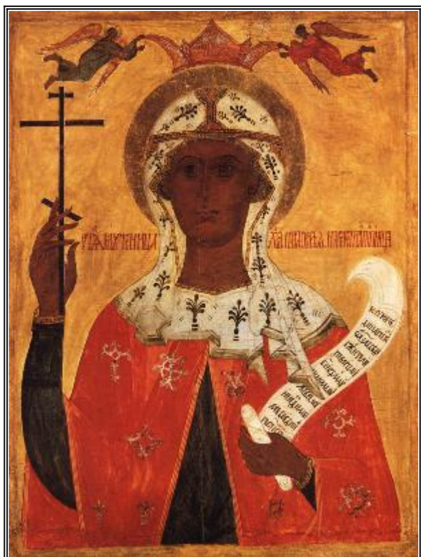
Св. великомъченица Параскева. Икона от Русия. 2-ра половина XVI в.

П о времето, когато нечестивият цар Диоклетиан повдигнал гонение срещу християните, в град Икония живеела една благородна и красива девица на име Параскева. Родителите и християни, като възпитали и научили дъщеря си да пази