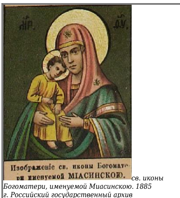
Изображение св. иконы Богоматери именуемой МИАСИНСКОЮ. св. иконы Богоматери, именуемой Миасинскою. 1885 г. Российский государственный архив