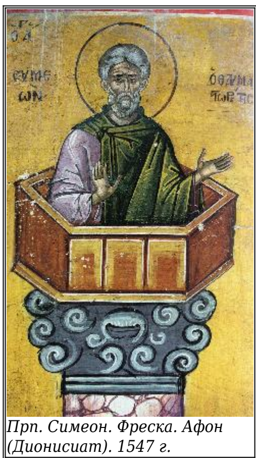
Прп. Симеон. Фреска. Афон (Дионисиат). 1547 г.