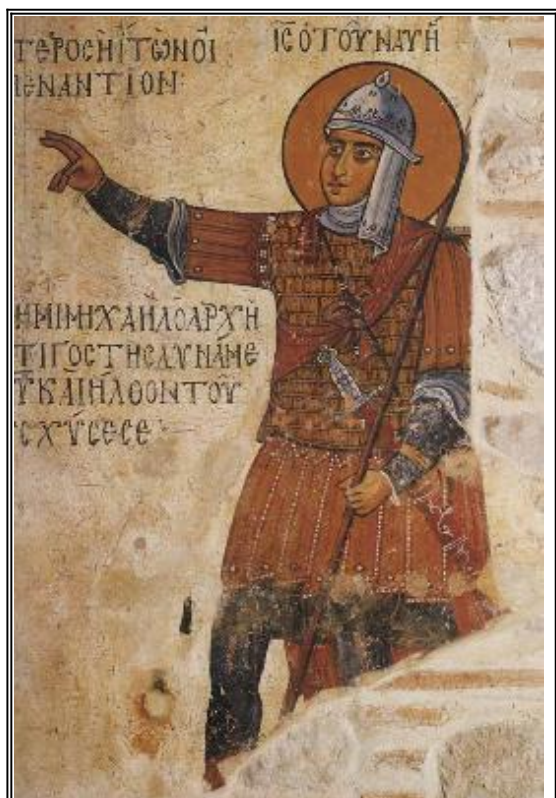
Прав. Иисус Навин. Фреска монастыря Осиос Лукас. Греция. XI в.