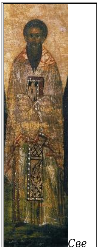
Св щеномъченик Василий Анкирски. Годишна минейна икона. Русия. 1-ва половина на XVI в.

С вети Василий, презвитер на църквата в град Анкира,