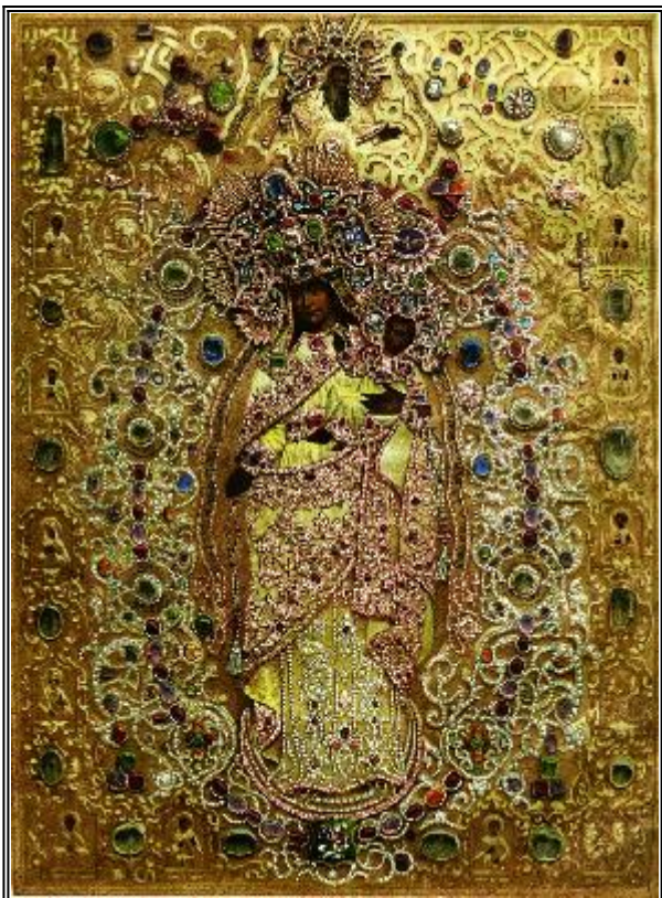
Чудотворна икона "Радост на всички скърбящи" на царицата Наталия Алексеевна. Църква "Скорбященской" в гр. Петербург

Есть мнение, что первоначальный образ Богоматери «Всех скорбящих Радость» перевезен был в Петербург царевной Наталией Алексеевной и есть именно тот образ, который стоит в Скорбященской церкви, на Шпалерной. Но, кажется, ближе к истине те, которые утверждают, что первоначальный образ остался в Москве.