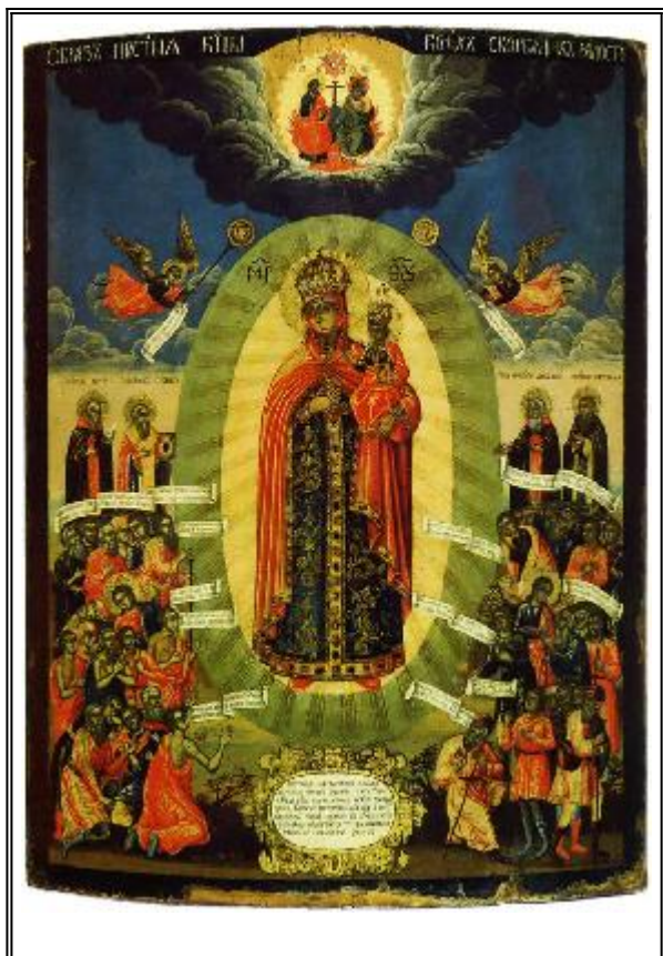
Чудотворна икона "Радост на всички скърбящи". Храм "Спаса Преображения" на Большой Ордынке - гр. Москва

С колько утешительного заключено в одном уже имени этой иконы — будящем, укрепляющем веру людей в Богоматерь, как в дивную Заступницу, которая спешит всюду, где слышится стон страдания людского, утирает слезы плачущих и в самом горе дает минуты отрады и радости небесной. Радуйся же вечно Ты, небесная скорбящих Радость!