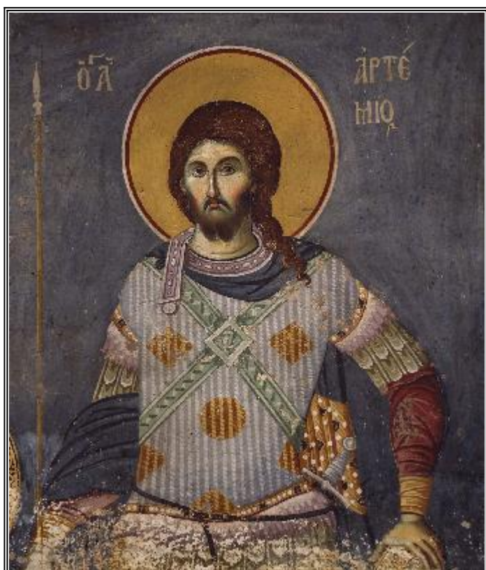
Великомученик Артемий, Византия, XIV в.

Страдание на свети великомъченик Артемий