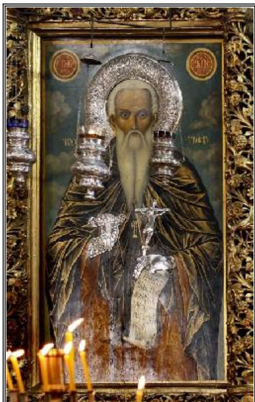
Св. Йоан Рилски Чудотворец - чудотворна икона

Житие на преподобния и богоносен наш отец Иоан Рилски, пустинножител и чудотворец († 946)