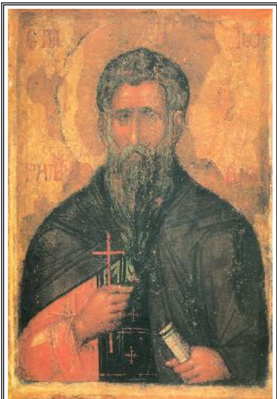
Прп. Иоанн Рыльский. Икона. Болгария. XIV в.