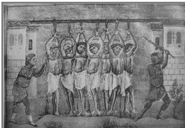
Мч. Уар и семь мучеников. Миниатюра Миналогия Василия II. Константинополь. 985 г.

Когато вързаните светии били доведени при наместника, тържествено седнал на съдийското място, той започнал да ги принуждават да принесат жертви на идолите.