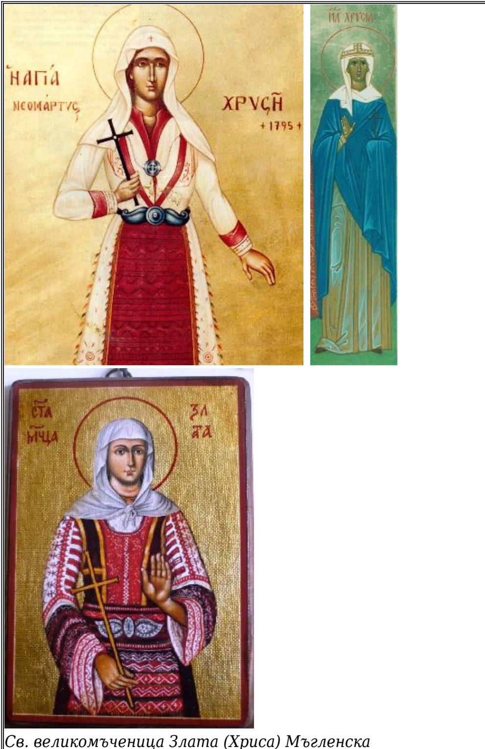
Св. великомъченица Злата (Хриса) Мъгленска

2. Мъглен - средновековен български град, епископско седалище в Южна Македония (днешна Гърция). Съществувал до 18 век.