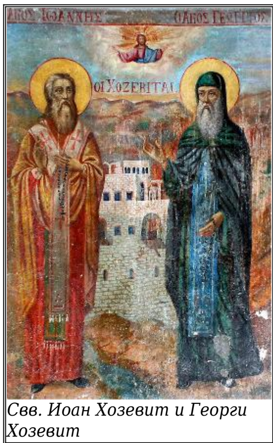
Свв. Иоан Хозевит и Георги Хозевит

П реподобният наш отец Иоан Хозевит бил родом от град Тива, намиращ се в Египет. Той бил постриган в монашество от своя чичо и по съвета на този старец ходил до светите места в Иерусалим. След завръщането си той прекарал със стареца няколко дни, след което се отдалечил в едно тясно дефиле, където намерил неголяма пещера и живеел там, като се хранел само с корени и треви. Когато Бог поискал да прослави Своя угодник, показал това по следния начин. По тези места живеел един велик постник на име Анания. Веднъж при него довели сина на един човек, измъчван от нечист дух. Анания не го приел, но с дълбоко смирение им казал да отидат във вътрешността на страната и там да потърсят Иоан египтянина, който може да изцели момчето. Когато изпратените намерили