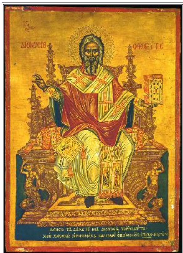
Св. Дионисий Ареопагит. Икона от Атина. 1729 г.

Житие и страдание на свети священомъченик Дионисий Ареопагит († ок. 96)