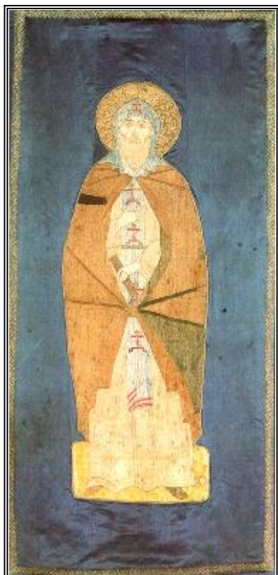
Покров от свете мощи на св. преподобни Григорий Пелшемски. Шевица от Русия. XVI в.

П реподобный Григорий происходил из города Галича 6161 от благородных и благочестивых Галичских дворян Лопотовых, и тщательно был воспитан в научении книжном. Познав суету настоящего мира, он отверг ее и покинул родительский дом. Ища удобного места для богомыслия, он пришел в Желтоводский монастырь к преподобному игумену Макарию 6162 , принял от него пострижение и в его монастыре поучался подвигам иноческой жизни, преуспевая особенно в постничестве. За его строгую добродетельную жизнь блаженный Макарий сподобил его принять на себя сан священства. Затем преподобный Григорий был назначен