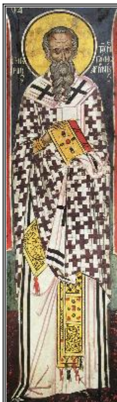
Св. свещеномъченик Григорий. Фреска от Атон, манастир Дионисиат. 1547 г.

Житие и страдание на свети свещеномъченик Григорий, епископ и просветител на Велика Армения, и на тридесет и седем девици заедно с него (ок. 335 г.)