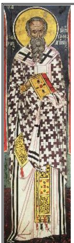
Сщмч. Григорий. Фреска. Афон (Дионисиат). 1547 г.

Житие и страдание на свети священомъченик Григорий, епископ и просветител на Велика Армения, и на тридесет и седем девици заедно с него