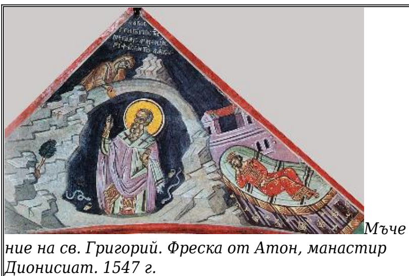
Мъчение на св. Григорий. Фреска от Атон, манастир Дионисиат. 1547 г.

Като чул тези думи, царят пламнал от голяма ненавист заради кръвта на баща си и заповядал да вържат ръцете и нозете на Григорий и да го хвърлят в един дълбок ров в град Артаксат. Този ров бил страшен за всеки, дори и само мисълта за него. Изкопан за осъдените на люта смърт, той бил напълнен с блатна тиня, змии, скорпиони и различни видове отровни гадини.