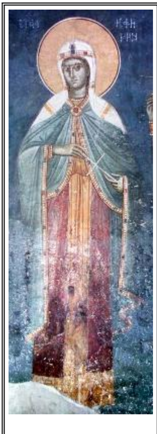
Св. великомъченица Евфимия. Фреска от църквата "Благовещение" в Грачаница, Косово, Сърбия. Около 1318 г.

По това време на едно тайно място се криели четиридесет и девет християни и възнасяли молитви. Сред тях била и една прекрасна девица на име Евфимия, от благородно потекло, дъщеря на благочестивия сенатор Филофрон и съпругата му Теодоросия. Донесли на мъчителя за тях и той заповядал да ги хванат и да ги доведат при него на съд. Свирепите му слуги веднага с оръжие в ръце се устремили като зверове на плячка върху събраното Христово стадо. Домът, където вярващите тайно служели на Бога, бил обкръжен от всички страни, за да не може никой да избяга. Слугите разбили вратите и без милосърдие помъкнали християните един по един навън, а когато хванали всички, с унижения и насмешки ги повели при