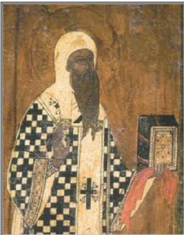
Свети Киприан (Цамблак), митрополит Киевски и на цяла Русия. Фрагмент от икона от XVII в., "Успенски събор" на Московския Кремъл

В памет на светителя Киприан, митрополит Киевски (1406 г.)