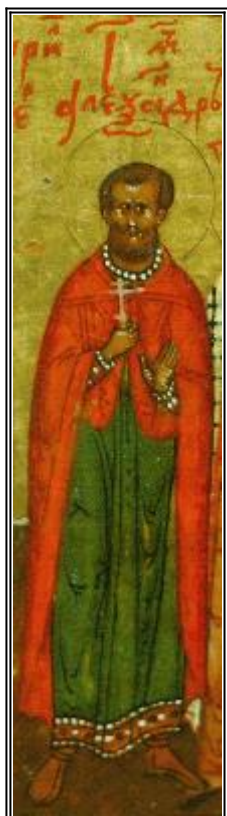
Св. Александър Воин. Фрагмент от икона от миня за Юни. Русия. Началото на XVII в.