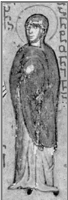
Мъченица Антонина. Миниатюра от Атон (Иверски манастир)