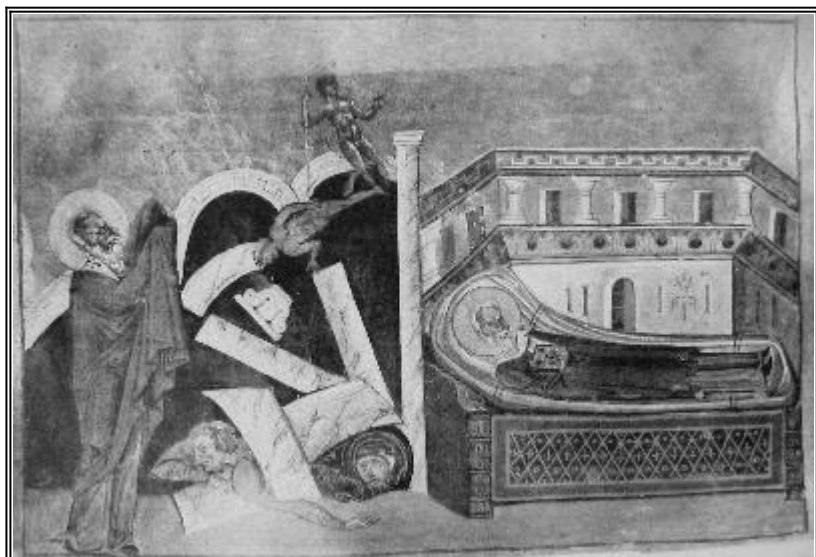
Св. свещеномъченик Корнилий. Миниатюра от минологията на Василий II. Константинопол. 985 г.

примката на дявола, който ги е живи уловил, за да изпълняват волята му”. Тогава князът казал: - Заклех се в боговете си, че не ще те пощадя и ще те подложя на жестоки мъчения, ако не принесеш жертва на боговете. - На кои богове ми заповядваш да принеса жертва? - попитал свети Корнилий.- Принеси жертва на Аполон и Дий - отвърнал властникът.- Покажи ми твоите богове - поискал светият.Князът се зарадвал и като си мислел, че той иска да им се поклони, го завел в храма на Дий. След тях вървели хора, които искали да видят как свети Корнилий ще се поклони на идолите. Когато стигнали до храма, всички влезли вътре. Там била и Евантия, жената на княза, и синът му Димитриан, наречен на името на баща си. Щом влезли в идолския храм, Корнилий се обърнал с лице на изток и като преклонил колене, се молел така: - Боже, Който разтърсваш земята и превръщаш планините в морски бездни! С ръката на Даниил си съкрушил Ваала, умъртвил си змията, затворил си устата на лъвовете и си съхранил невредим Твоя раб. Разруши и сега тези идоли и дай на хората да познаят Твоята силна мишца!