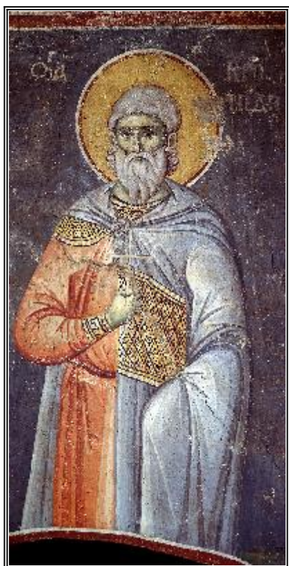
Мъченик Кронид Александрийски

С вети Селевк бил родом от Галатия, Стратоник - от Никомидия Витинска, а светите Кронид, Леонтий и Серапион - от Египет.