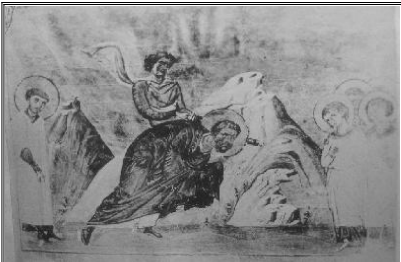
Сщ.мчч. Фавст пресвитер, Авив диакон и сподвижници их. Миниатюра Минология Василия II. Константинополь. 985 г.