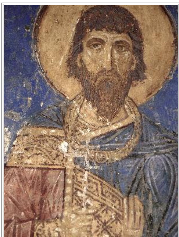
Святой мученик Евдоксий. Фреска Спасо-Мирожского монастыря. XII век

С вети Евдоксий живял през царуването на Диоклетиан, жестокия гонител на Църквата Божия. Този император издал нечестива заповед, която забранявала в неговата империя да се отдава поклонение на Единия истинен Бог и изисквала честта, подобаваща на Бога, да се въздава на немите бездушни идоли. След огласяването на тази заповед мнозина от