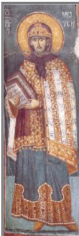
Свети пророк Моисей. Фреска от църквата "Успение Богородично" в манастира Протат на Атон. Начало на XIV в.

С лед смъртта на Иосиф потомството на Иаков, неговия баща, в продължение на неколкостотин години толкова се