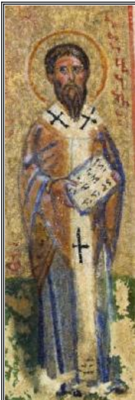
Свещеномъченик Вавила. Миниатюра от Атон - Иверски манастир. Края на XV в.

Страдание на светия свещеномъченик Вавила и на тримата юноши с него