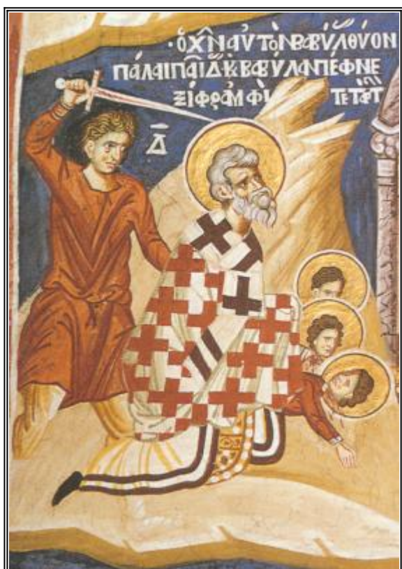
Мъченичество на свв. Вавила, Урван, Прилидиан и Еполоний. Фреска от Атон - манастир Ватопед. 1721 г.

“Върни се, душо моя, в своя покой, защото Господ ти стори добро” (Пс. 114:7).