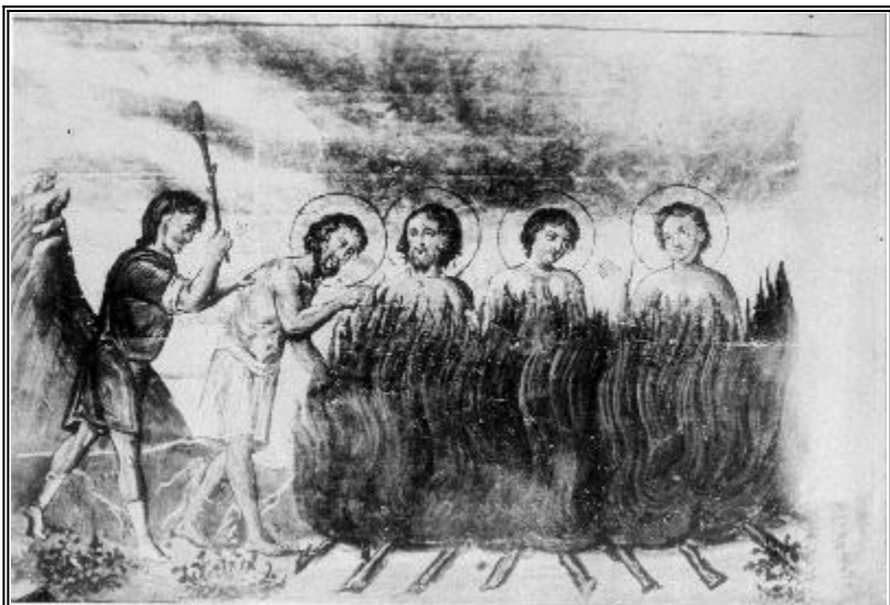
Мъченичество на свв. Теодор, Миан, Иулиан, Кион Кандавлски, Никомидийски. Миниатюра от Минологията на Василий II. Константинопол. 985 г.

Т ези свети мъченици живели при царуването на Максимиан и били родом от село Кандавла. За изповядването на Христа били хванати и предадени на различни мъчения. В началото така жестоко стъргали телата им, че се показали костите им. След това ги затворили в силно затоплена баня, чиито врати запечатали с царския пръстен, така че светите мъченици да не могат да излязат. Но ангел Божий ги извикал, и те излезли от банята невредими, при запечатани врати. Войниците ги взели и ги извели извън града. По молба на светците им било дадено време за молитва. Те дълго се молили и благодарели на Бога за това, че ги е удостоил да претърпят мъчения за Христа. След това телата им били разсечени на части, коленете им били раздробени, и накрая те самите били хвърлени в огън, където с радост предали душите си на Господа.