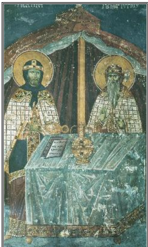
Скиния. Фреска от църквата "Успение Богородично" в манастира Протат на Атон. Начало на XIV в.

Когато скинията била готова и осветена с всичките ѝ принадлежности с помазен елей, я покрил облак и я изпълнил цялата, така че сам Моисей не могъл да влезе в нея. И той поставил вътре в скинията кивота на завета, обкован със злато, в който сложил златната стомна с манната, разцъфналият Ааронов жезъл и скрижалите на завета, а над кивота поставил изображения на два златни херувима и устроил всичко необходимо за жертвоприношения и всесъжжения. След това светият пророк установил за израилтяните празници и новомесечия и им поставил свещеници и левити, избирайки за служение на Бога, по Негова заповед, цялото Левиево коляно и отдавайки го на разпореждане на Аарон и синовете му. Много други знамения и чудеса извършил Божият раб Моисей, много грижи положил за израилтяните, много закони и разумни разпореждания им дал. За всичко това се разказва в написаните от него свещени книги: Изход, Левит, Числа,